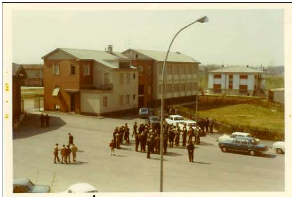
casa parrocchiale, l'oratorio ... e "campagna circostante"