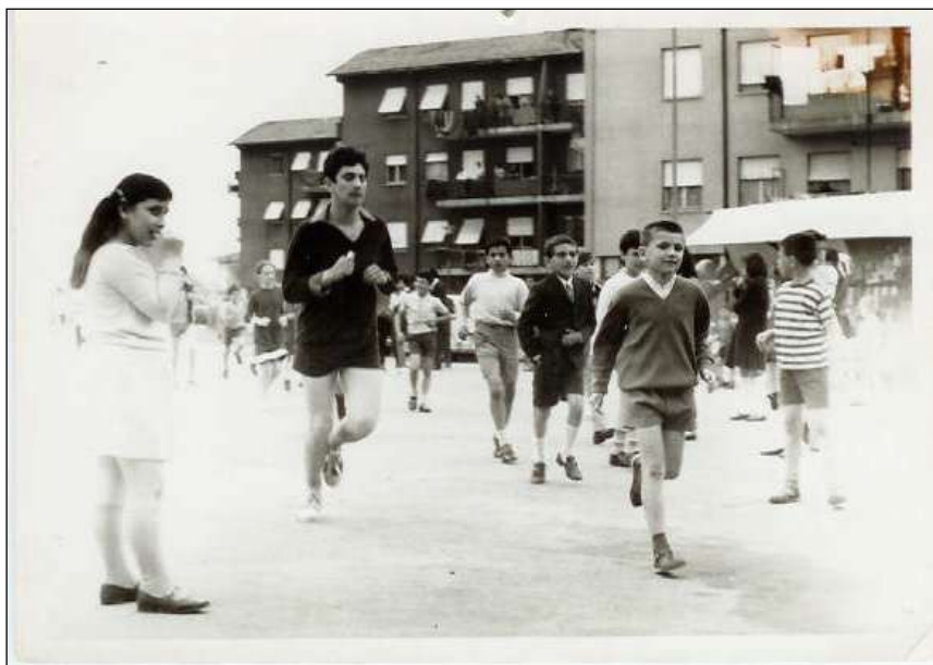
Il giro intorno ai palazzi di Via Bolivia