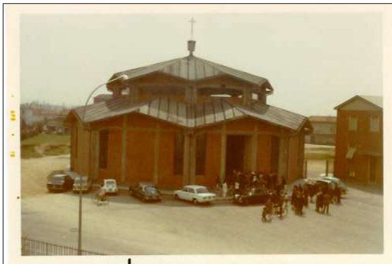
foto del piazzale