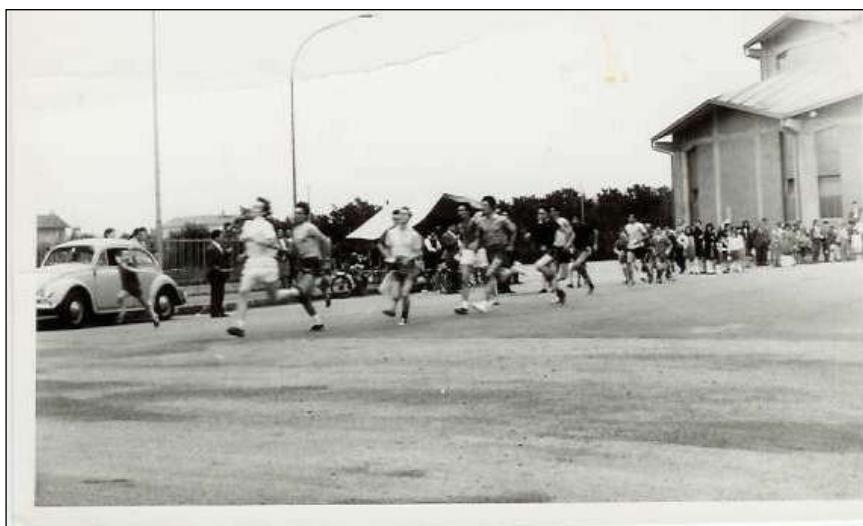
immagini di una corsa campestre, la partenza davanti al portone della chiesa